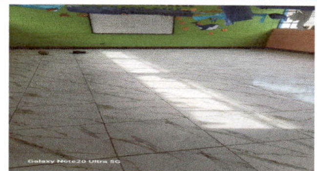
Foto 6: Apreciación de dos salones de clases con el piso sustituido por cerámico.

Observación: Si es necesario se pueden agregar hojas adicionales y actualizar el número de hojas.