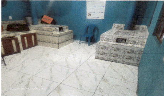
Foto 1: Sustitución piso liso por cerámico y remodelación de dos planchas para mayor eficiencia en la preparación de los alimentos.