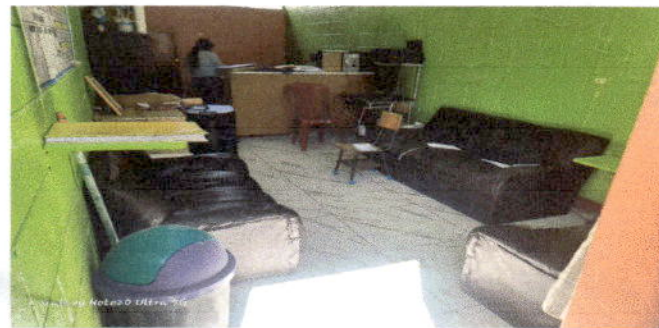
Foto 5: Sustitución de piso por cerámico en las instalaciones de la dirección del establecimiento.