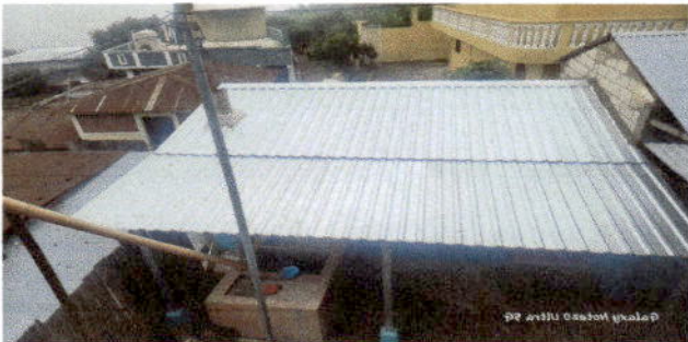
Foto 3: Observación del tejado nuevo y sustitución del sistema de cableado eléctrico. Adicional, mejoras en la iluminación de la misma.