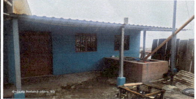
Foto 2: Presentación de la fachada de la cocina donde puede apreciarse la instalación de dos ventanas, sustitución del tejado y extensión del mismo hacia afuera para cubrir la pila.